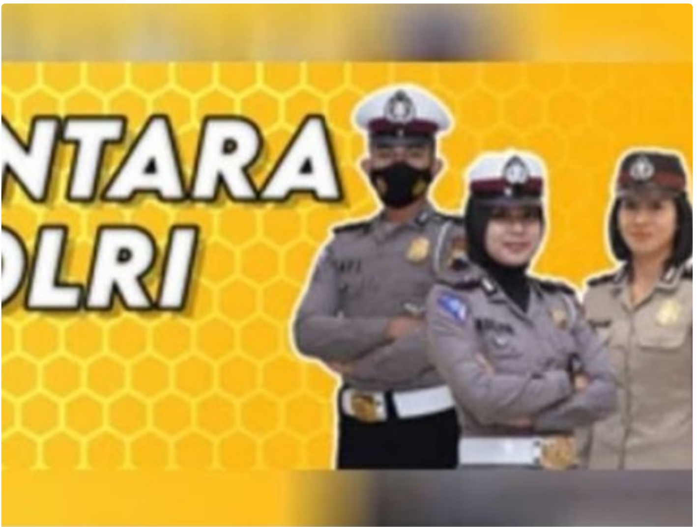
Penerimaan Polri Bakomsus

PALANGKA RAYA - Kesempatan terbuka bagi lulusan bidang pertanian, perikanan, peternakan, gizi, dan kesehatan masyarakat untuk bergabung menjadi anggota Polri melalui program penerimaan Bintara Kompetensi Khusus (Bakomsus).